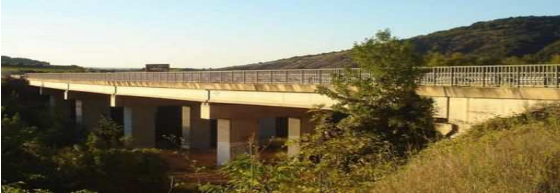
Ouvrage de la Marguerite Est (phase 2)

Il s'agit de la phase qui concerne les travaux programmés du 31 janvier au 24 juin 2022 . Elle vise à traiter l'autre pont sur la Marguerite sens sud-nord (partie Est), construit en 1980. Des études de diagnostic et un projet de remise à niveau ont été réalisés.