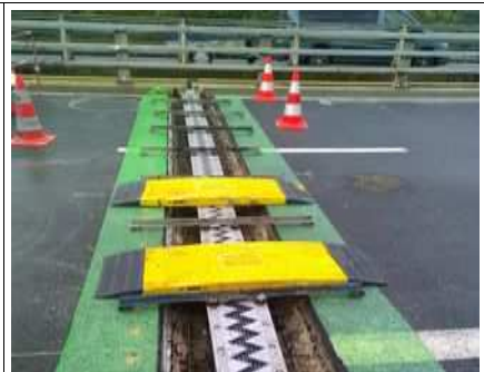
Changement de joint de chaussée