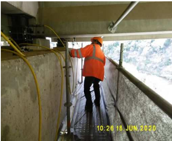
Vérinage de l'ouvrage de la Lergue Est (phase 1)

La phase 1 a été menée en deux temps en 2020 (fortement impactée par la crise Covid-19), elle a concerné trois ponts construits en 1990 et 1991 : les deux ouvrages du sens sud/nord (partie Est) sur la Lergue (viaduc à travées indépendantes, poutres précontraintes par post-tension) et celui du sens nord-sud sur la Marguerite (partie Ouest) (poutres précontraintes par adhérence). Ces trois ouvrages ont fait l'objet d'une remise à niveau des conditions d'appui et des équipements défectueux.