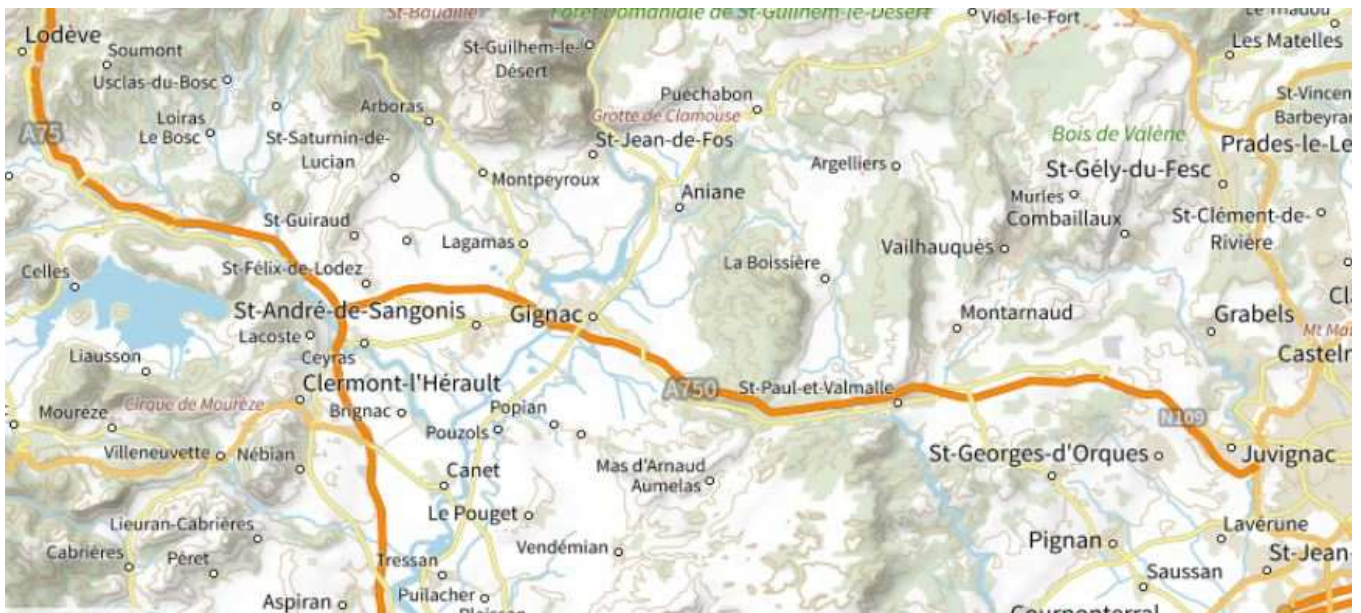
carte de situation des travaux - commune du Bosc (34700)