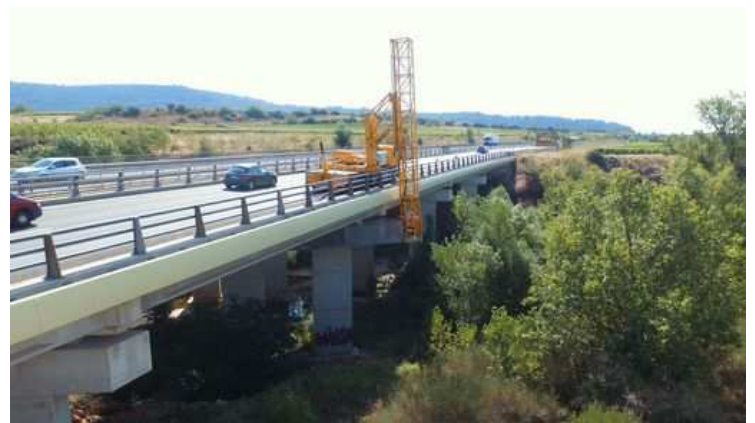
Travaux Marguerite Ouest (phase 1)

La phase 1 a été menée en deux temps en 2020 (fortement impactée par la crise Covid-19), elle a concerné trois ponts construits en 1990 et 1991 : les deux ouvrages du sens sud/nord (partie Est) sur la Lergue (viaduc à travées indépendantes, poutres précontraintes par post-tension) et celui du sens nord-sud sur la Marguerite (partie Ouest) (poutres précontraintes par adhérence). Ces trois ouvrages ont fait l'objet d'une remise à niveau des conditions d'appui et des équipements défectueux.